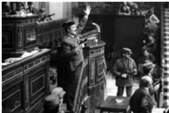
Tejero dins de l'hemicicle en el moment del segrest del Congrés dels Diputats.

El Cop d'Estat del 13 de Setembre de 1923, acceptat pel mateix Alfons XIII, va significar la Reimplantació d'una Dictadura Militar que va anul·lar les institucions polítiques pròpies d'un sistema liberal parlamentari i es governà sense cap Constitució i a cap decret amb força de Llei. Aquesta intromissió militar, després del breu parèntesi de la Segona República Espanyola (1931-1936) durarà fins al 1975, quan acaba la llarguíssima dictadura de Francisco Franco; dictadura que s'inicià el 17 de Juliol de 1936 mitjançant un Cop d'Estat que van protagonitzar un sector de l'alta oficialitat de l'Exèrcit Espanyol i els sectors conservadors i que, a més, va fer esclatar la Guerra Civil Espanyola (1936-1939).