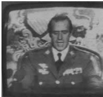
El Rei Joan Carles I, fent el seu discurs que va posar fi al 23-f

A partir d'aquell moment la Corona, així com la monarquia i la figura del Rei, es consolidarien dins del procés democràtic iniciada el 1977 i de l'estructura del país del país.